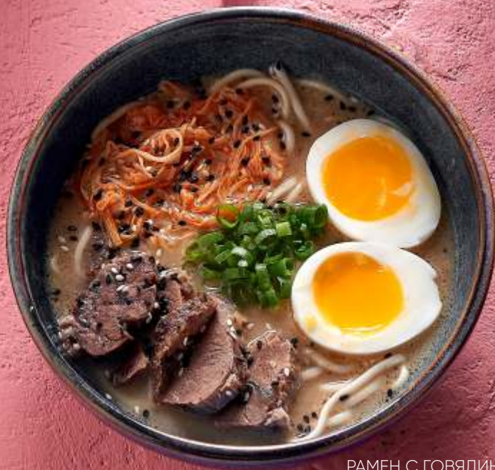
РАМЕН С ГОВЯДИНОЙ