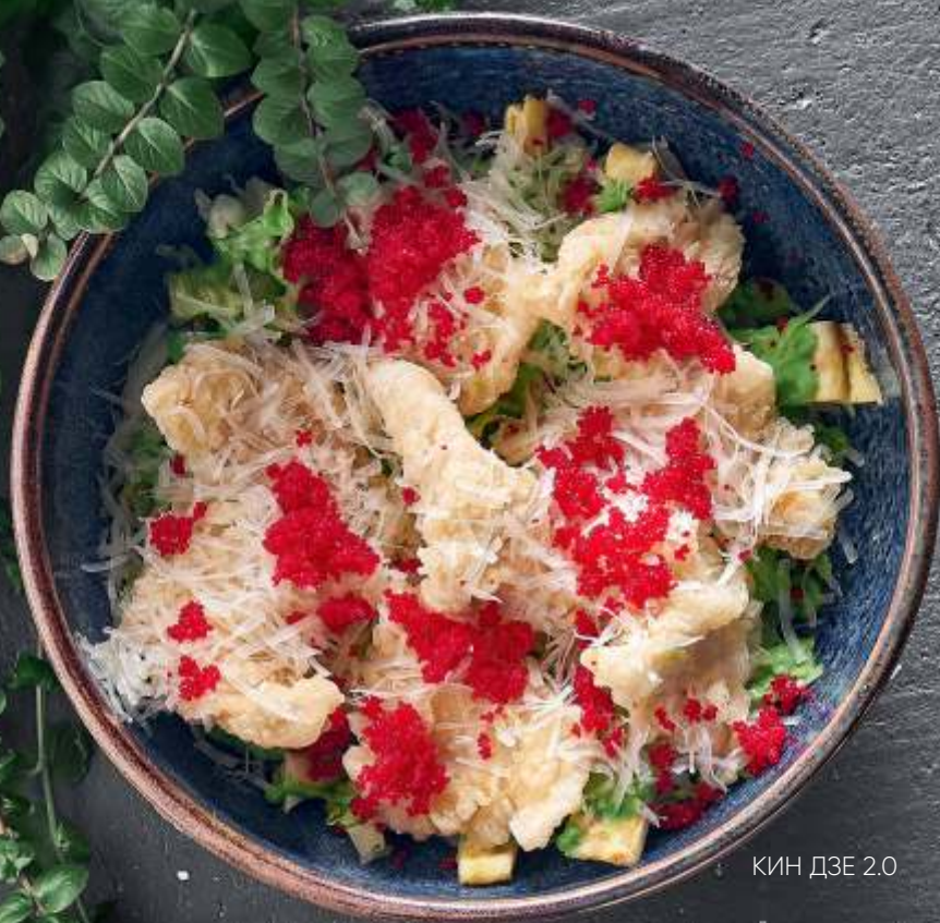
КИН ДЗЕ 2.0