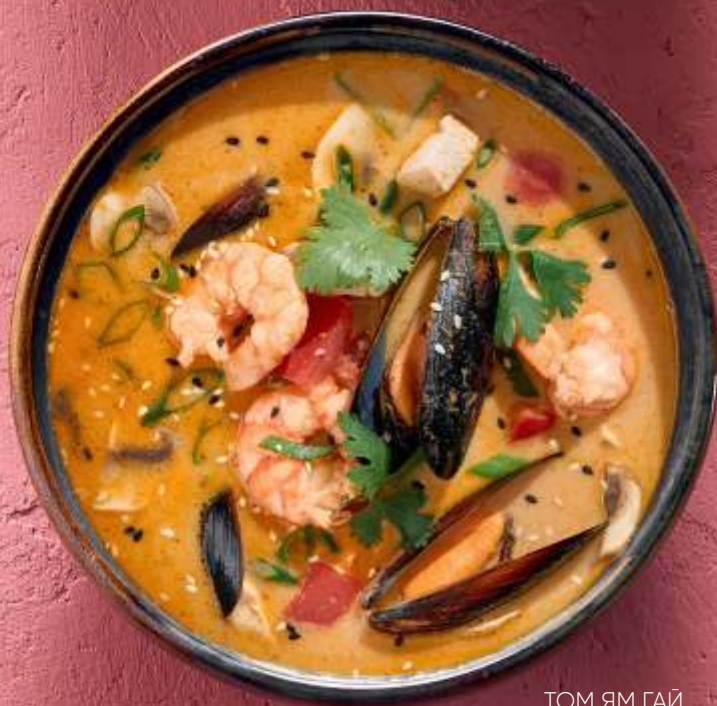
ТОМ ЯМ ГАЙ