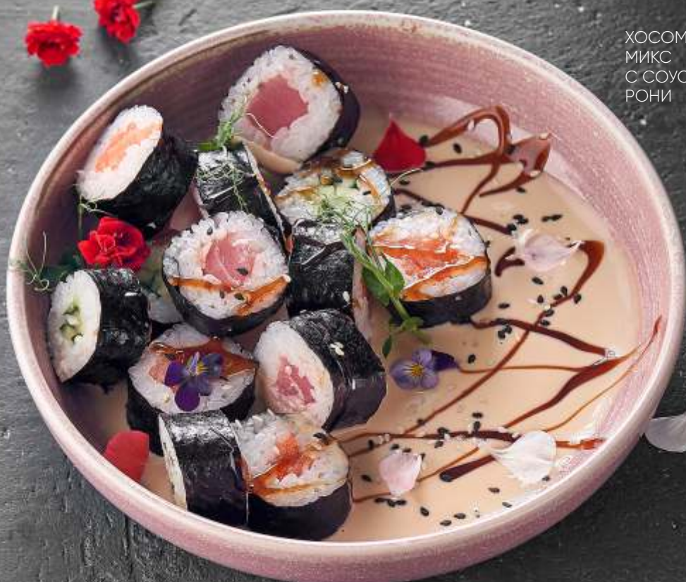
ХОСОМАКИ МИКС С СОУСОМ РОНИ