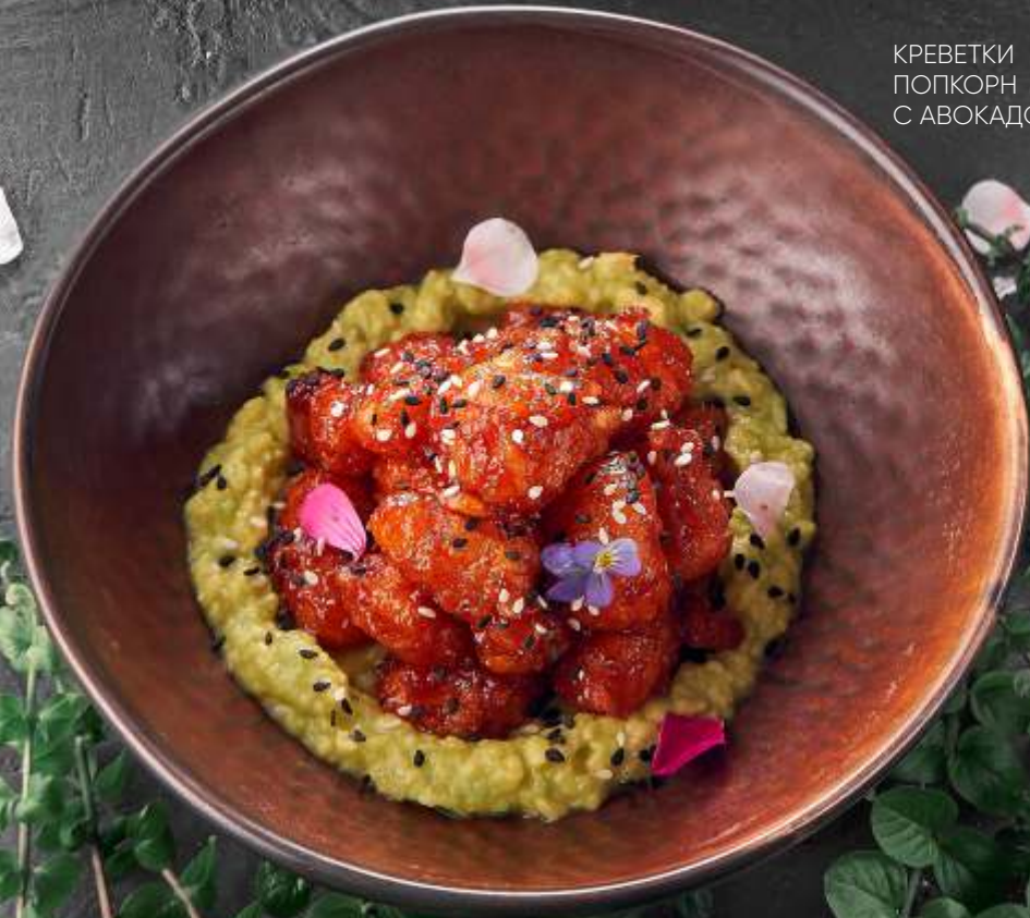
КРЕВЕТКИ ПОПКОРН С АВОКАДО