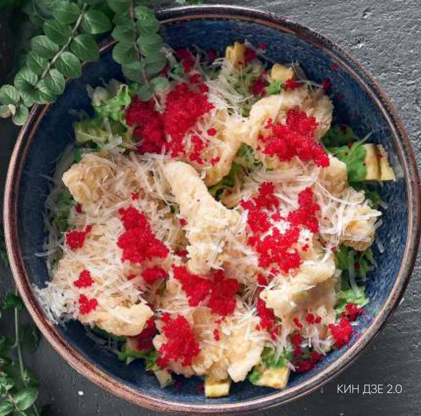
КИН ДЗЕ 2.0