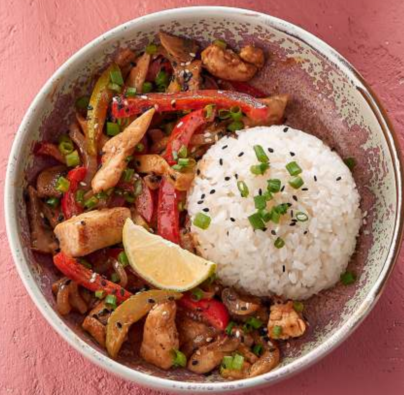
КУРИЦА С ОВОЦАМИ И РИСОМ В СОУСЕ ТОМ ЯМ