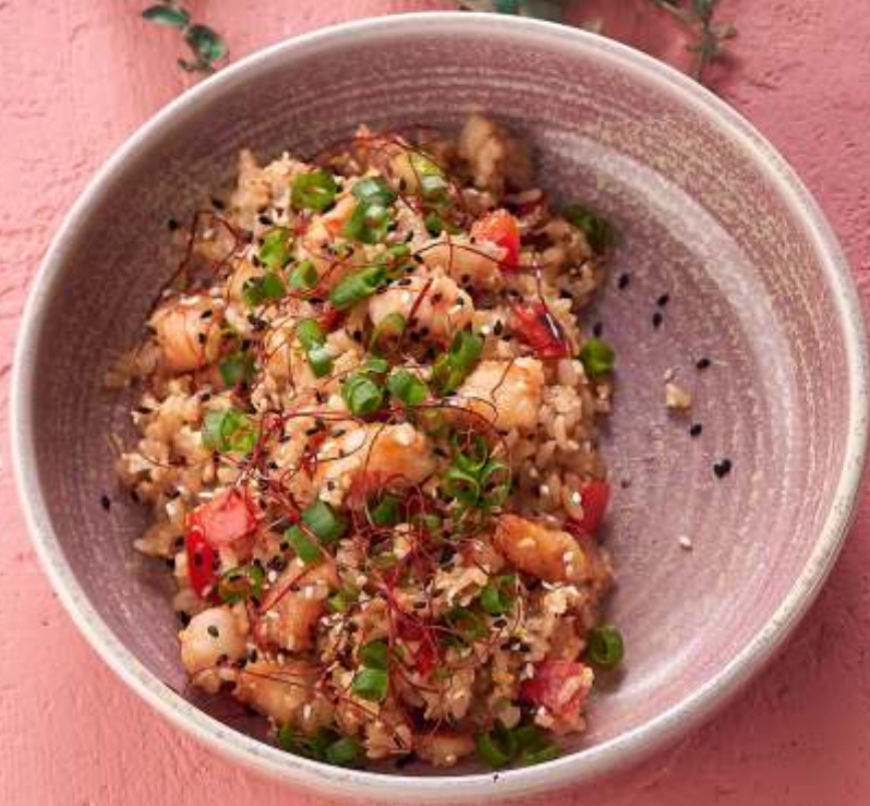
ВОК С КРЕВЕТКАМИ