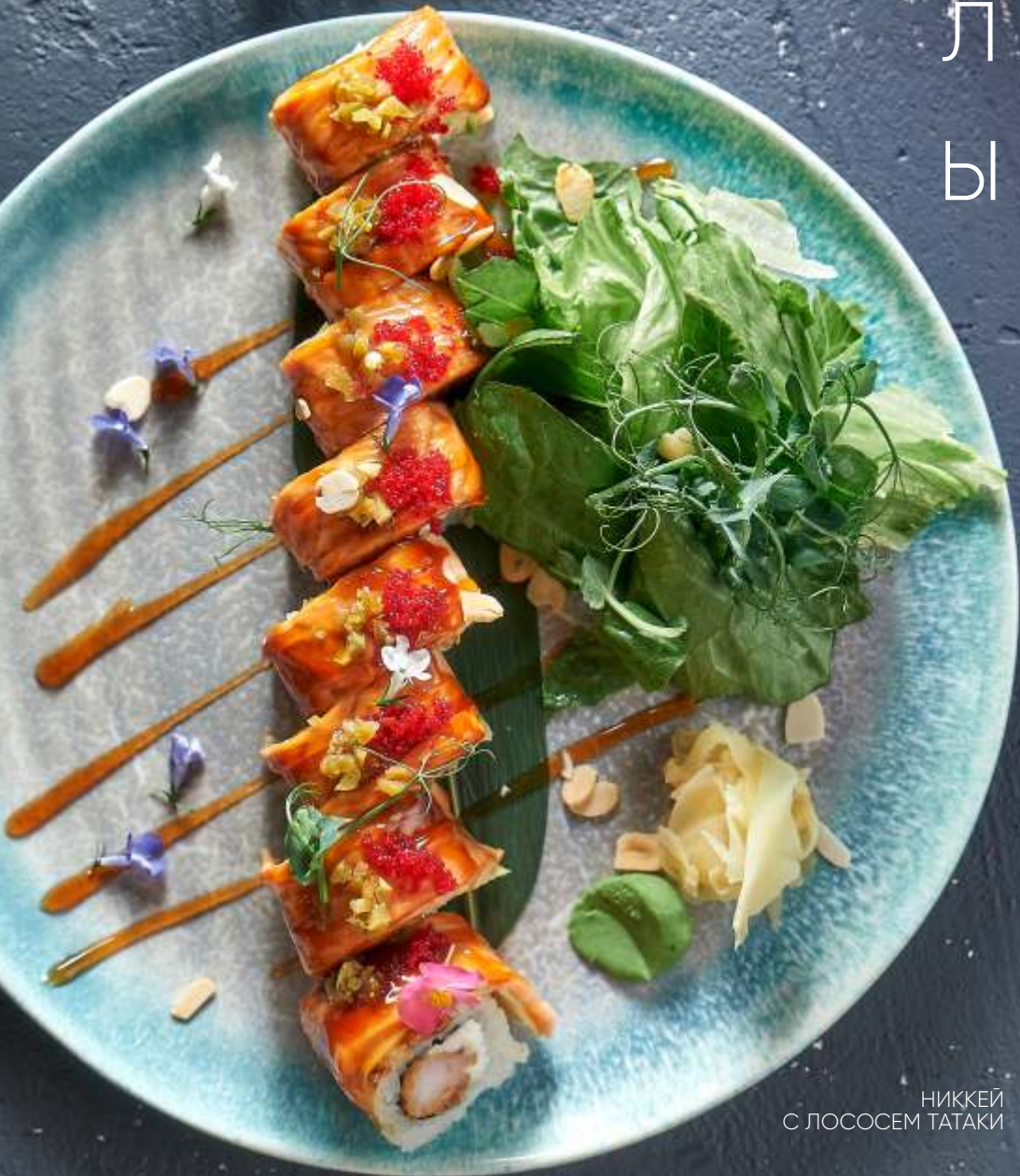
НИККЕЙ С ЛОСОСЕМ ТАТАКИ