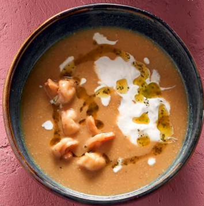
ТЫКВЕННЫЙ КАРРИ С КРЕВЕТКАМИ И СТРАЧАТЕЛЛОЙ