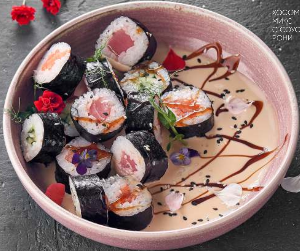
ХОСОМАКИ МИКС С СОУСОМ РОНИ