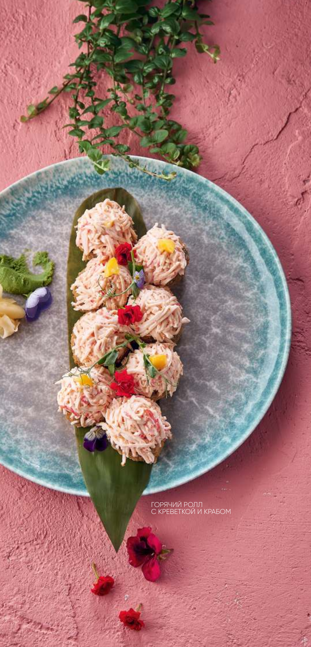
ГОРЯЧИЙ РОЛЛ С КРЕВЕТКОЙ И КРАБОМ