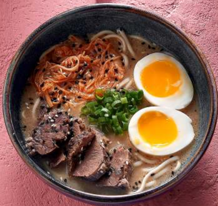
РАМЕН С ГОВЯДИНОЙ