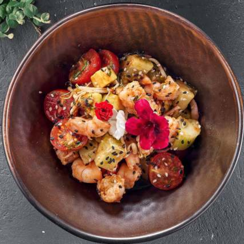
СЕВИЧЕ С КРЕВЕТКАМИ ТОМ ЯМ