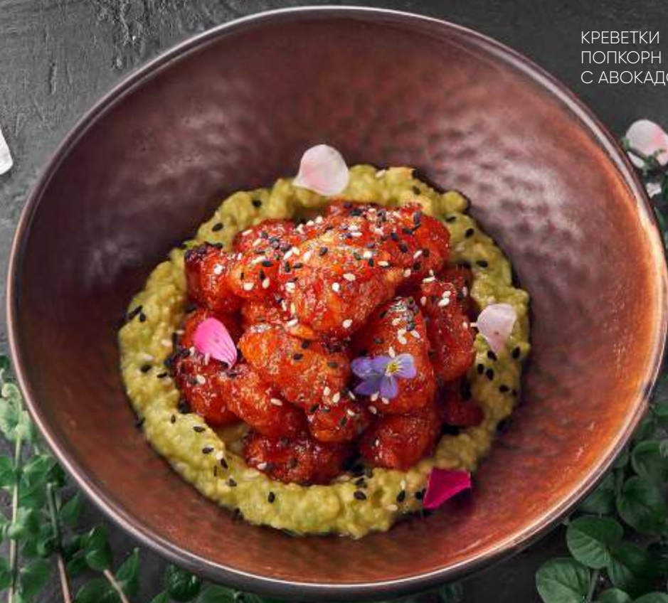
КРЕВЕТКИ ПОПКОРН С АВОКАДО